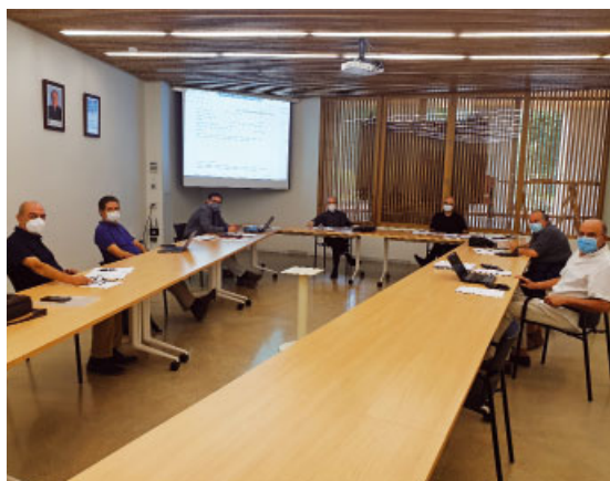
Consell per als Assumptes Econòmics