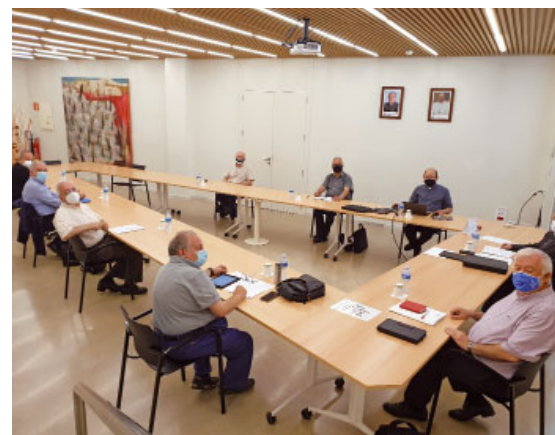
Col·legi de Consultors

En aquesta setmana que hem transcorregut, s'han reunit dos organismes del bisbat: el Consell per als Assumptes Econòmics, dimarts dia 8, i el Col·legi de Consultors, l'endemà dimecres 9.