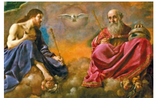
La Santíssima Trinitat (1616-1617) de Giovanni Francesco Barbieri (Il Guercino). Palau Magnani, Bolonya (Itàlia)