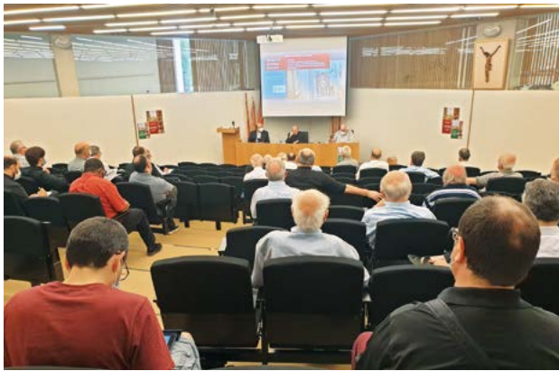
Preveres i diaques, a la reunió de final de curs