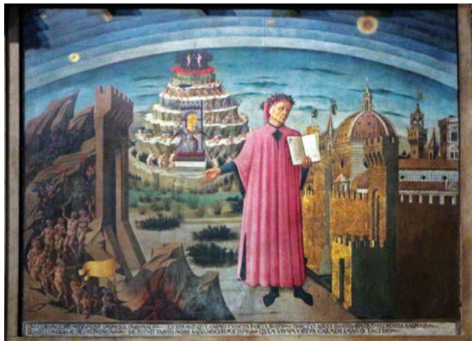
Dante i el seu poema (1465), de Domenico di Michelino. Catedral de Santa Maria del Fiore, Florència (Itàlia)

El passat 25 de març, Solemnitat de l'Anunciació del Senyor, el Papa va fer pública una Carta Apostòlica, que gairebé ha passat desapercebuda: Candor Lucis Aeternae . L'ocasió d'aquesta Carta és el 700è aniversari de la mort del gran poeta Dante Alighieri. El seu argument respon a una cosa que es va afirmant des dels primers segles de l'Església, que va ser centre de la Constitució del Vaticà II Gaudium et Spes i que, precisament a propòsit del poeta florentí, han subratllat els últims papes, des de Lleó XIII a Benet XVI. És a dir,