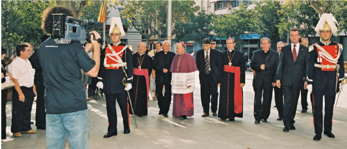
Arribada a la catedral, el 12 de setembre de 2014.

ciar molt més els laics, malgrat potser estem encara a mig camí.