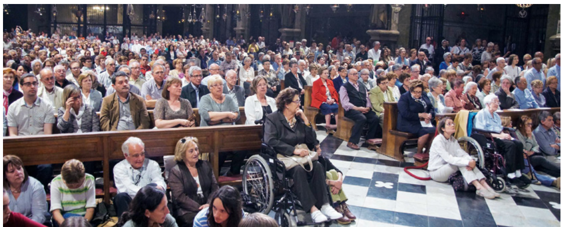
Celebració del 10è aniversari diocesà a Montserrat

Associar decididament els laics a la vida pastoral. Aquesta crida no és genèrica, és concreta: a persones, a laics, a la comunitat... per assumir serveis, ministeris... dins de les parròquies i de la diòcesi. Els pastors hem de fer el nostre paper però és claríssim que, ni per eclesiologia ni per les nostres forces, sols no podem. És el Poble de Déu, som els batejats, laics i laiques, amb l'acompanyament i l'ajut dels pastors, que hem de fer camí... Per això, convocar els laics, fer-los confiança, procurar-los formació, donar encàrrecs i responsabilitats.