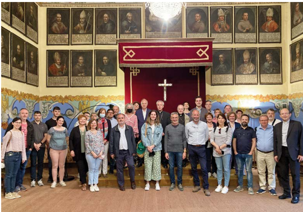
Membres de les cúries de Vic i Sant Feliu de Llobregat

Després dels dos anys de restriccions per la pandèmia, el passat 20 de maig es va reprendre el costum de realitzar una sortida de convivència i cultural dels treballadors de la Cúria, que aquesta vegada els va portar fins a Vic.