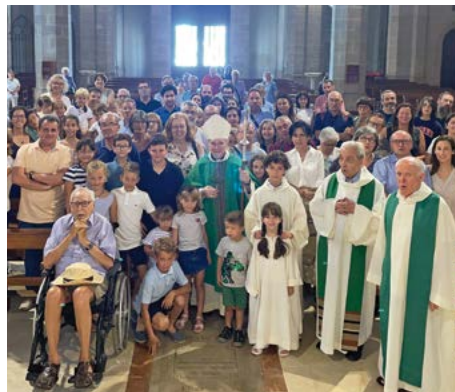
Cloenda diocesana de l'Any de la Família a Sant Pere de Ribes

Coincidint en el temps, a Sant Pere de Ribes, es va dur a terme l'acte de celebra-