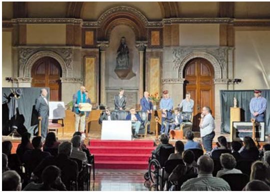
Representació del grup de teatre del Seminari

A l final de curs, la vida sembla que s'intensifica, al Seminari i a tot arreu... Fem una mica de crònica i agenda d'algunes cites dels nostres seminaristes en aquest període.